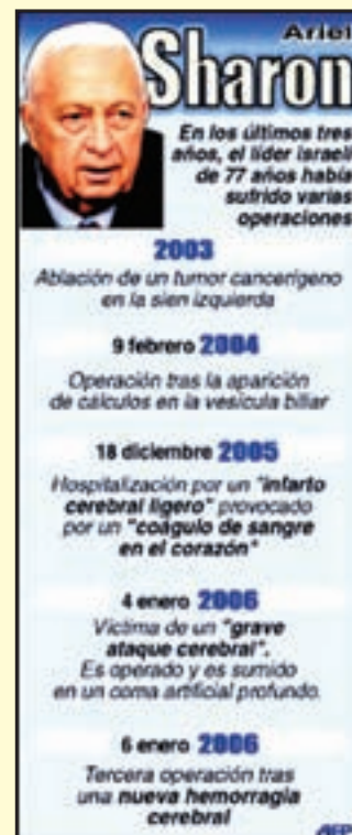
Un lista di e problemanan di salud di e Prome Minister Ariel Sharon.

JERUSALEM—E docternan lo cuminsa awe, pa lanta Ariel Sharon for di coma artificial, pero ya a adverti cu apesar di e mihorianan registra, ta practicamente descarta cu e prome minister di 77 año, lo recupera shen porshento, y por bolbe